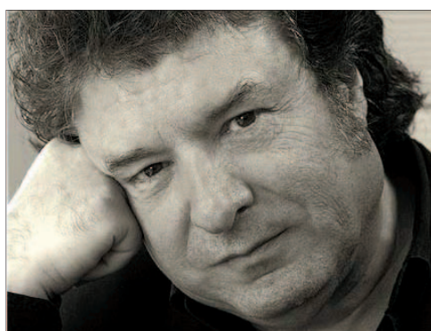
Enrique Morente, que cerrará la Bienal.